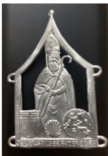
Pilgerzeichen der Jakobusfreunde Paderborn

Allerdings gab es im Mittelalter bereits ähnliche Pilgerzeichen, auch als Pilgermarken bekannt. Es waren Abzeichen, meist in Form kleiner Plaketten oder Medaillen, die vorwiegend im Mittelalter an Wallfahrtsorten verkauft und auf der Pilgerfahrt am Hut oder an der Kleidung getragen wurden.