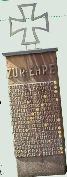
Andreasberg (Gemeinde Bestwig): Ehrenmal für die Gefallenen und Vermissten der beiden Weltkriege (Zusammenstellung und Auswahl der Abbildung: Bernhard Schaub)

Quellen: Andreasberg- Ein Blick in die Geschichte eines Bergarbeiterdorfes v. S. Haas Privatarchive und Zeitzeugenberichte