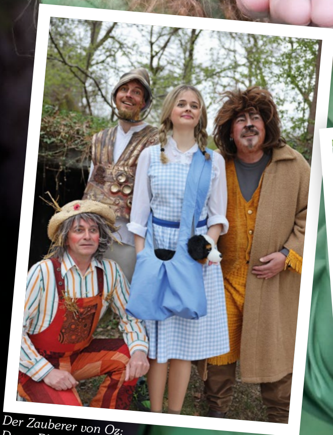
Der Zauberer von Oz: Doro, Blechmann, Strohhmann, Löwe