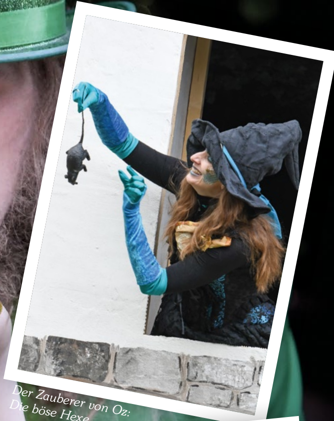
Der Zauberer von Oz: Die böse Hexe