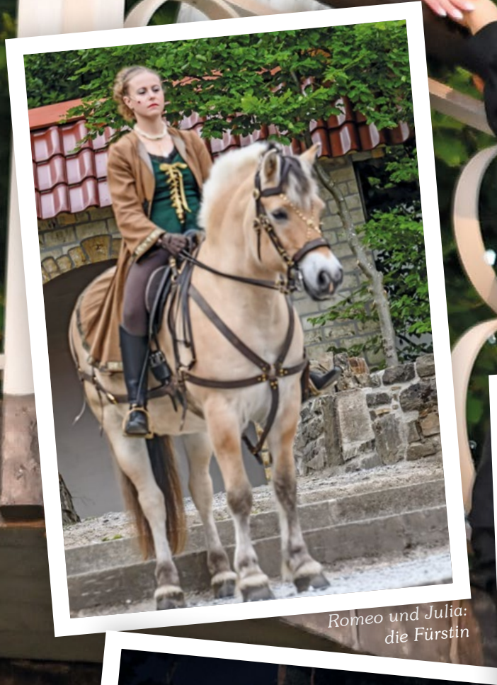
Romeo und Julia: die Fürstin