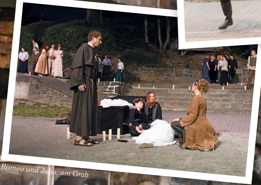
Romeo und Julia: am Grab