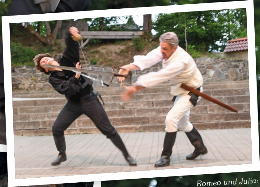
Romeo und Julia: Romeo im Kampf mit Thybald