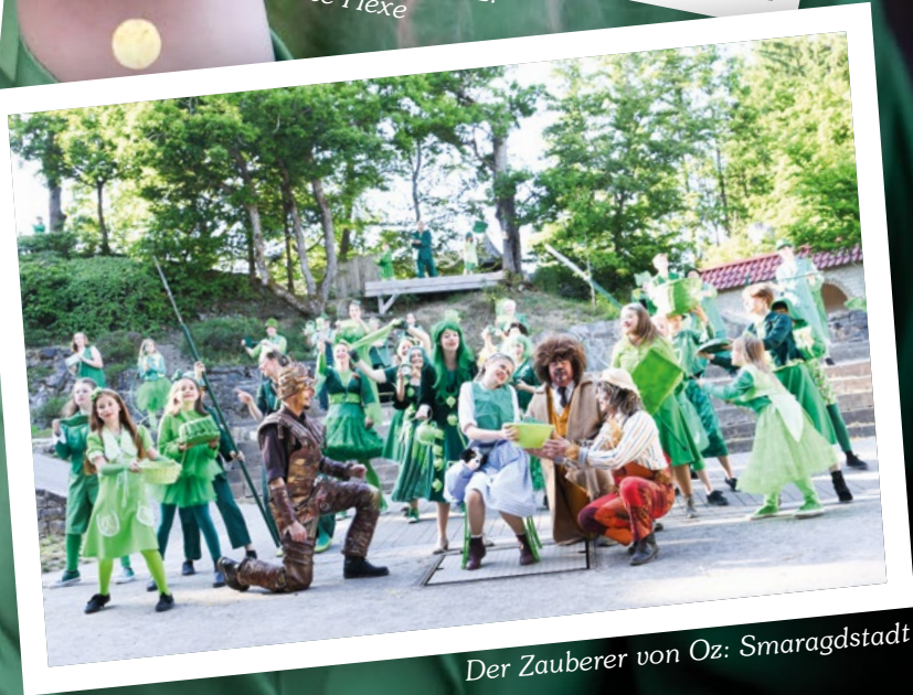
Der Zauberer von Oz: Smaragdstadt