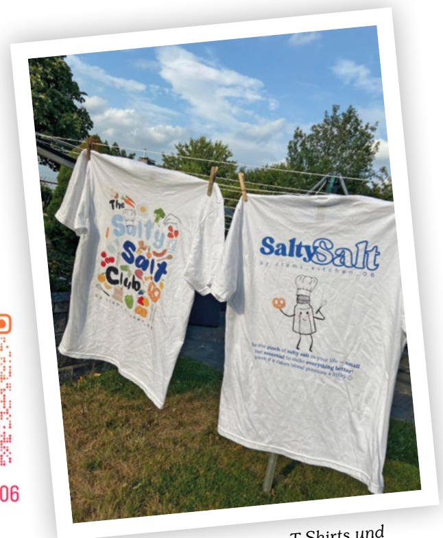
SaltySalt-Merch in Form von T-Shirts und Hoodies ist über das Internet zu erwerben