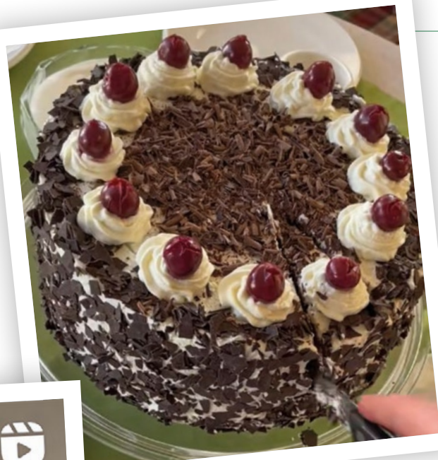
Kaffeestunde mit Schwarzwälder Kirschtorte

Für manche Follower steht vielleicht nicht nur German „HAUSMANNSKOST“ im Vordergrund. Gelegentlich liest sie in den Kommentaren auch: „Das erinnert mich an die Zeit mit meiner Oma“, oder „wie schön, dass du so viel mit deiner Oma zusammen machst“. Kritik an den Rezepten, wenn auch selten, bleibt natürlich nicht aus: „Sieht unappetitlich aus“ war beispielsweise ein Kommentar zum Hühnerfrikassee, oder „zu wenig gewürzt.“ Aber das ist ja Geschmackssache.