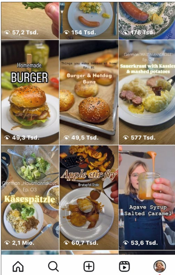
Eine beachtliche Produktpalette

German „HAUSMANNSKOST“ soll vorläufig ein Hobby bleiben. „Gerne möchte ich weiter machen.“ Inzwischen ist Clementine auch schon eine Kooperation mit dem Unternehmen GEFU (Es-lohe) eingegangen, das viele hilfreiche Haushaltsgeräte anbietet. GEFU trat an Clems_kitchen_06 heran, da die Firma ihren Account sehr schön findet und sie Clementine dabei gerne unterstützen möchte. Außerdem entwickelt GEFU selber praktische Dinge für Hausmannskost, wie zum Beispiel die Flotte Lotte , die auch heute beim Apfelmus Zubereiten zum Einsatz kommt. Hat das alles Auswirkungen auf Clementines Zukunftsplanung? „Es gibt so viele Möglichkeiten“, sagt die 19-jährige. Auf jeden Fall werden die Erinnerungen an die gemeinsame Zeit mit ihrer Oma und ihrem Opa nicht verblasen.