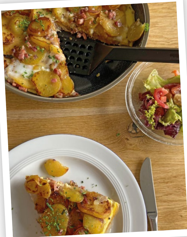
Bauernfrühstück – beliebt sowohl zum Frühstück als auch mittags und abends

Zu ihrer Motivation, sich mit den Kochrezepten ihrer Großeltern zu beschäftigen, gehört auch, dass aktuell fast nur noch moderne Gerichte auf social Media zu finden sind. Sie erinnert sich daran, dass eine Freundin und deren Mutter sich unterwegs ein Gericht mit Grünkohl holten, da sie dies Zuhause selber nicht zubereiteten. „Ich dachte da, dass ich mir so etwas woanders nie kaufen würde, da ich es Zuhause selber regelmäßig bei meinen Großeltern esse. Und so merkte ich, dass es heutzutage immer weniger Menschen gibt, die solche Gerichte zubereiten oder wissen, wie man sie macht.“