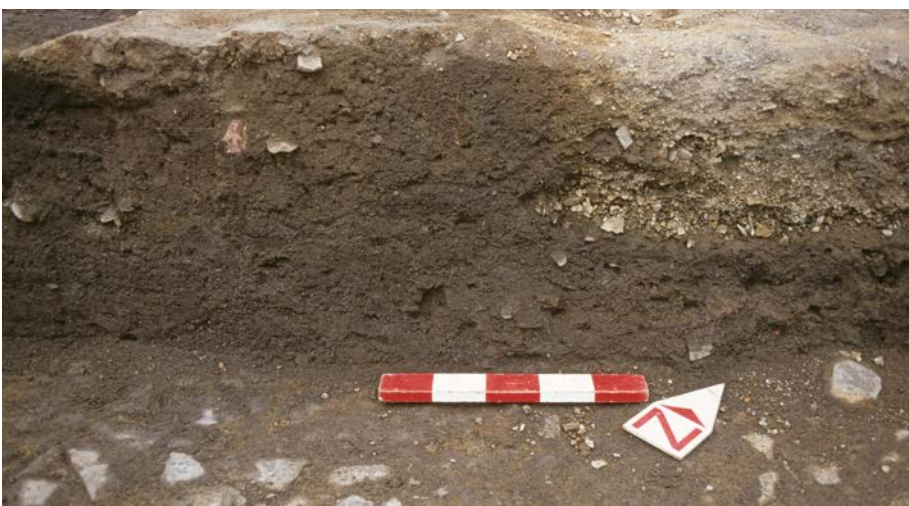
Die „Halde“ im Profil von Schnitt 20, Foto: Nowak-Klimscha 2017, Abb. 54, S. 52

Twesine liegt im Grenzgebiet zum Fränkischen Reich und stand sicher, wie die ganze Region, in engem Kontakt zu den Nachbarn. Dass die Lagerstätte und der Kupferbergbau die Begehrlichkeiten des fränkischen Herrschers geweckt hatten, ist leicht vorstellbar. Karl der Große machte in den Sachsenkriegen die Gegend zum Teil seines Reichs. Die Kriege begannen in unmittelbarer Umgebung zu Twesine, die Eresburg war das erste Angriffsziel. Mit der Eroberung vollzog sich offenbar auch ein Wandel in der regionalen Infrastruktur. Zwar endete die Kupferverhüttung in Twesine, dafür entstanden im 9. Jahrhundert entlang der Hellwegzone andere Orte, an denen Buntmetallverarbeitung nachgewiesen ist. Marsberger Kupfer wurde z.B. im Kloster Corvey verwendet. 5 In den Schriftquellen ist der Bergbau im