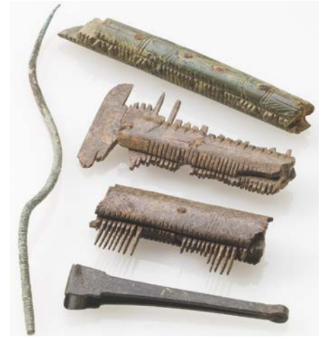
Eine Auswahl des Fundmaterials, hier: Kämme, eine Pinzette und eine Gewandnadel, Foto: LWL-Archäologie für Westfalen, Stefan Brentführer

Der frühe Nachweis der Nutzung der Rohstoffe vor Ort war unerwartet. Zeitgleiche mit Twesine vergleichbare Orte gibt es bisher in Nord- und Mitteldeutschland nicht. In der Forschung ging man davon aus, dass nach dem Ende des Römischen Reichs die Primärproduktion von Kupfer zum Erliegen kam und bronzene Objekte