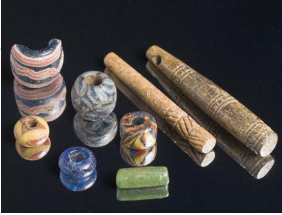
Eine Auswahl des Fundmaterials, hier: Perlen und sogenannte „Donaranhänger“, Foto: LWL-Archäologie für Westfalen, Stefan Brentführer

höhten Wohlstand der Bevölkerung und der Zugehörigkeit zur gehobenen Gesellschaftsschicht. Die überwiegende Anzahl dieser Funde stammt ebenfalls aus der Zeit des 6. bis zur ersten Hälfte des 9. Jahrhunderts. Es wird deutlich, dass Twesine von den Sachsenkriegen Karls des Großen (772 – 804) unberührt blieb und vor, während und nach der militärischen Auseinandersetzung bewohnt war. Nach Ausweis von Funden und Befunden lässt sich die Siedlungsentwicklung in drei Phasen einteilen: Phase 1 = 6. bis Mitte 9. Jahrhundert, Phase 2 = Mitte 9. bis 11. Jahrhundert, Phase 3 = 11. bis 13. Jahrhundert.