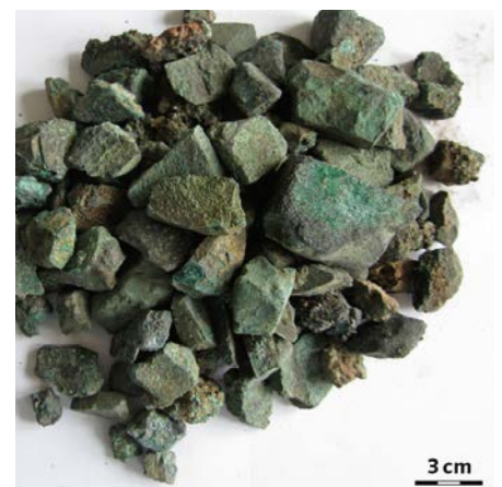
Gestein mit grünlichen Ausfällungen