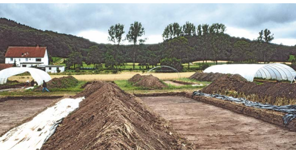
Blick auf die Grabungsfläche, Foto: Nowak-Klimscha 2017, Abb. 2, S. 3

Befund, die „Halde“, eine Ansammlung der Hinterlassenschaften der Metallverarbeitung vor Ort. Die Halde erreicht eine Stärke von 62 cm und erstreckt sich auf einer Fläche von 3000 qm durch die Siedlung. In Twesine wurden außerdem 34 sichere Feuerstellen ergraben, die mit der Buntmetallverhüttung in Zusammenhang stehen könnten. Die größte Fundgruppe stellt die Keramik (Fragmente von Haushaltsgeschirr, z.B. Töpfe, Teller, Krüge), rund 70 % des Materials stammt aus der Zeit zwischen dem 6. und der ersten Hälfte 9. Jahrhunderts. Besondere Aufmerksamkeit erregte jedoch die Vielzahl der qualitativ hochwertigen Kleinfunde, z.B. Perlen, Schnallen, Fibeln, Waffen, Reitzubehör. Sie zeugen von einem er-