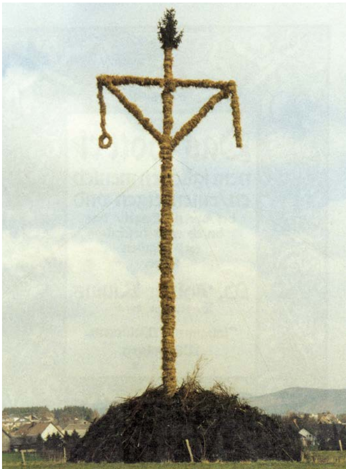
Osterkreuz Attendorf-Ennest 2004