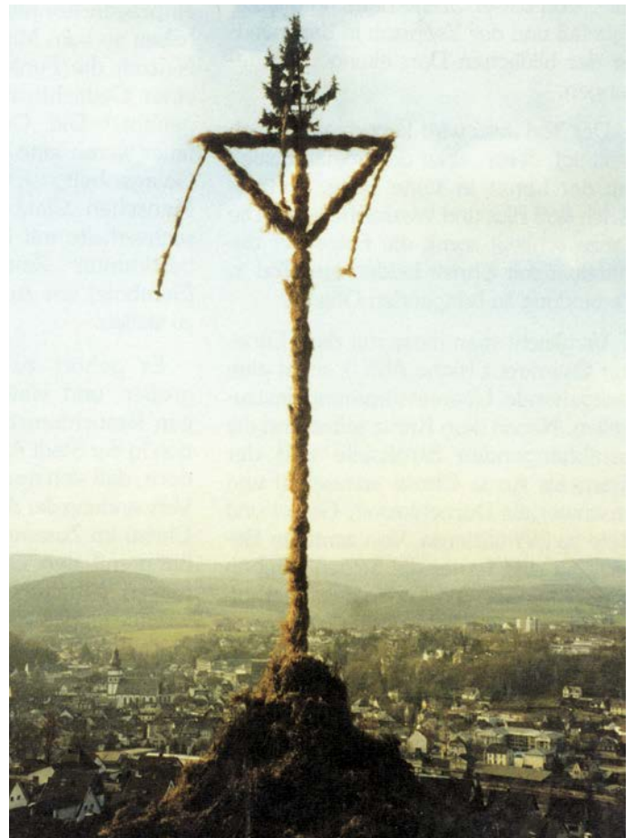
Osterkreuz Attendorf-Wassertor 2004